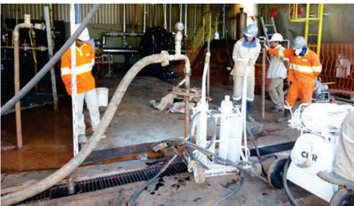
A Engegraut dispõe de técnicas específicas para tratamento de todo tipo de solo.

Um outro dado interessante é que o solo reforçado passa a trabalhar, imediatamente, sem perdas de tempo, e sem os inconvenientes causados por soluções a base de estacas ou colunas, que impõe transferência de cargas, não resolvendo o problema como um todo.