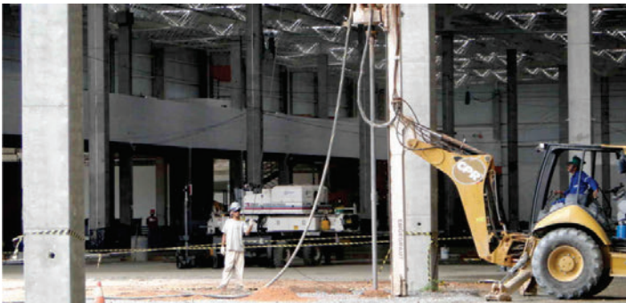
Problemas de afundamento de pisos são rapidamente tratados, corrigindo-se com o renivelamento do piso.

Toda a mecânica executiva é acompanhada com monitoramento do excesso e dissipação da poropressão causada que, com os módulos pressiométricos, indicam o grau de consolidação e rigidez impostos. O resultado é o aumento substancial da resistência efetiva e da rigidez do solo, ao longo de toda a sua profundidade.